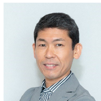
ひふみワールドマザーファンド ファンドマネージャー