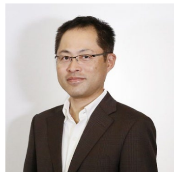
ひふみグローバル債券 マザーファンド ファンドマネージャー