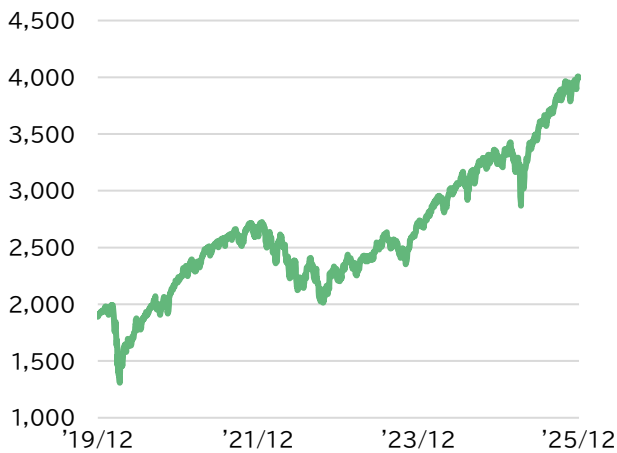
■ MSCI ACWI ex JAPAN(配当込み)(米ドルベース)の推移