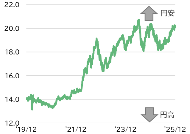
■ 香港ドル／円の推移